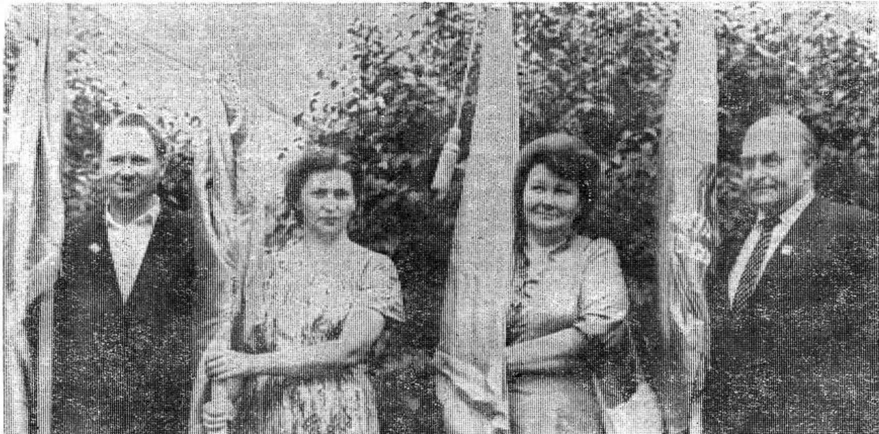
Красные знамена — коллективам-победителям социалистического соревнования.

В заключение вечера состоялся большой праздничный концерт хора ветеранов войны и труда Псковского Дома культуры профсоюзов.