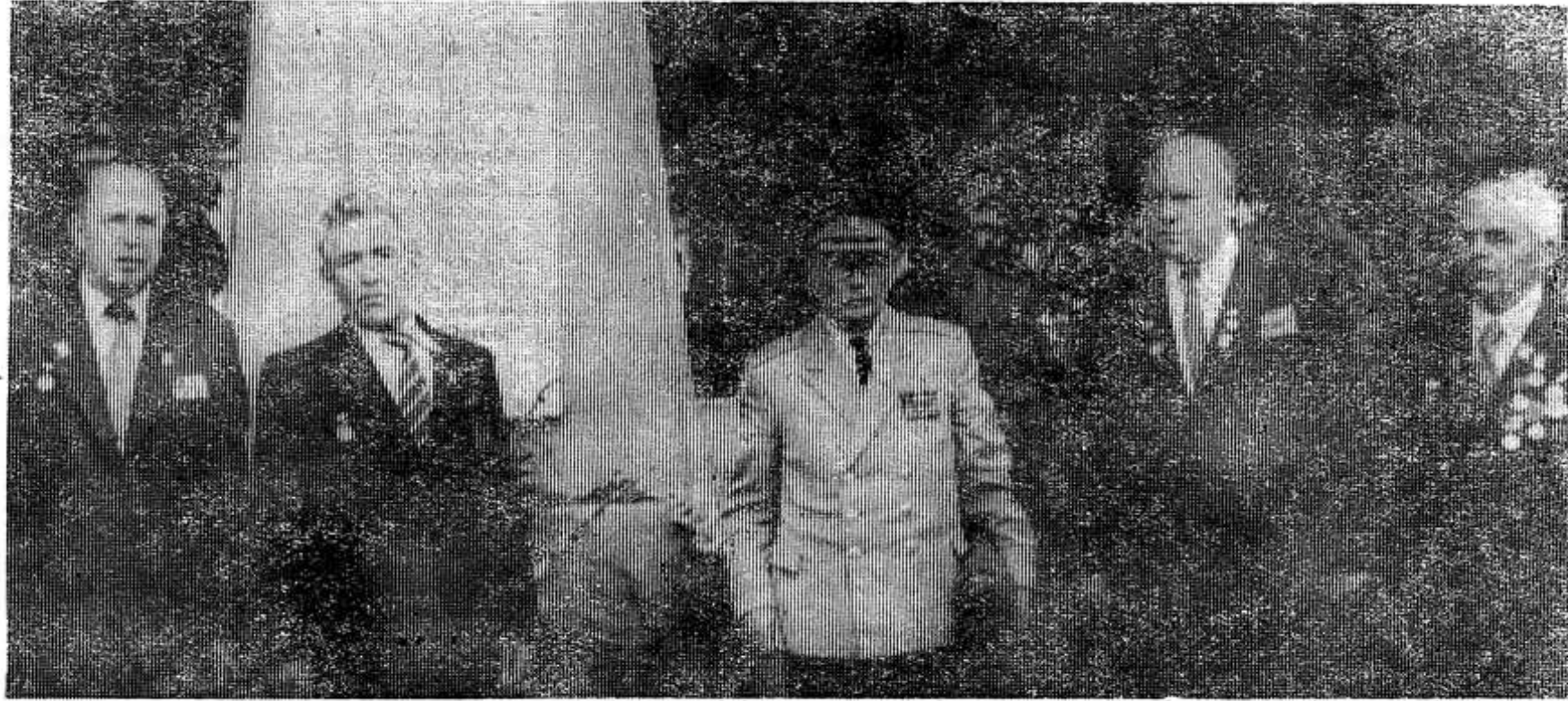
Ветераны войны у памятника освободителям Опочки.

СОРОК лет прошло с тех пор, как на территории нашего района отгремели последние бои. Славному юбилею освобождения района от немецко-фашистских захватчиков было посвящено торжественное собрание трудящихся, состоявшееся в пятницу, 13 июля, в Доме культуры. Сотни людей — бывшие партизаны и воины действующей армии, жители города, гости до отказа заполнили зал, где проходило собрание.