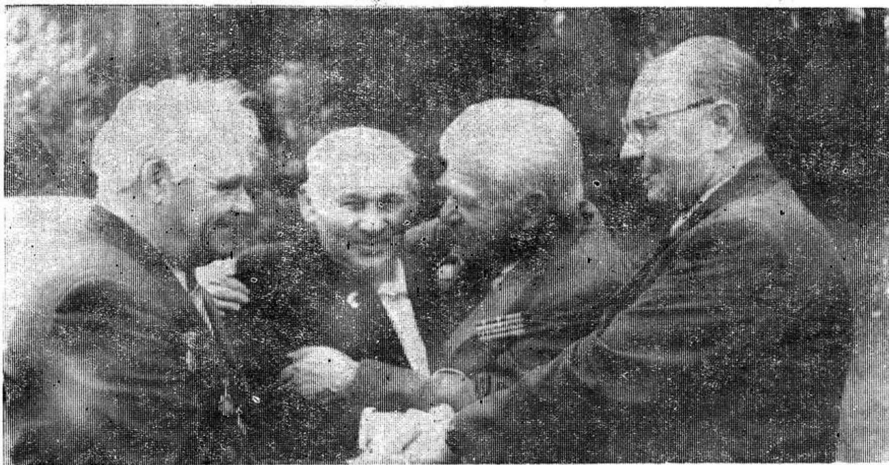
Встреча через сорок лет.

Многих нет уже среди нас. Но оставшиеся в живых до конца дней своих будут с благодарностью вспоминать