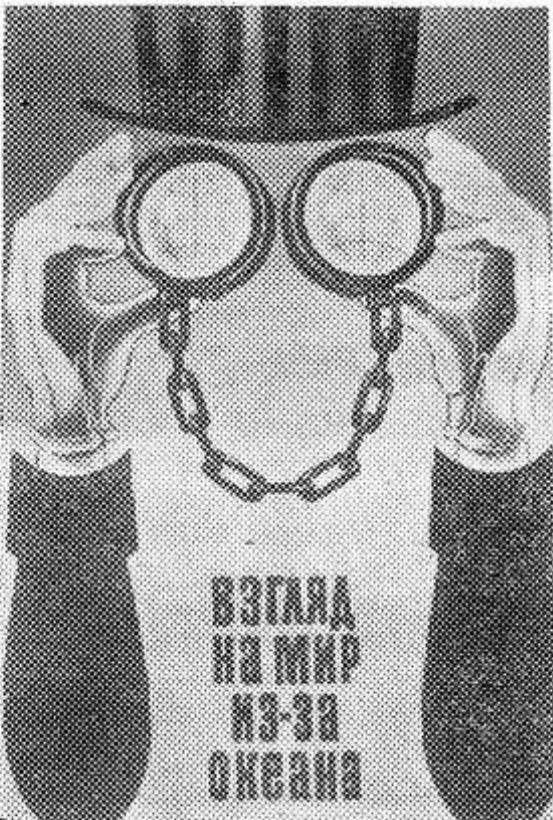
МОСКВА. Сейчас, когда в мире неспокойно, когда человечеству грозит опасность быть ввергнутым в пучину ядерной катастрофы, все

миролюбивые силы стремятся остановить гонку вооружений, устранить саму возможность войны.