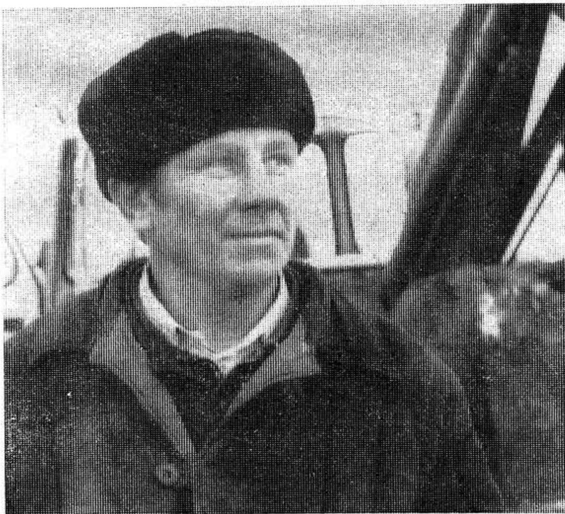
Это примерно на два дня работы.