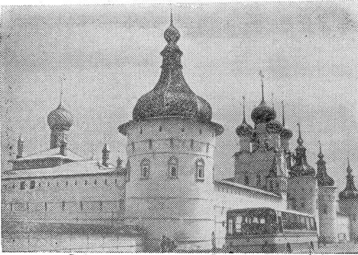
НА НИЖНЕМ СНИМКЕ: Ростовский кремль — памятник архитектуры XVI—XVII веков.

Сейчас фонды музея насчитывают около 50 тысяч экспонатов. Среди них — работы русских живописцев XIV — XVII веков.