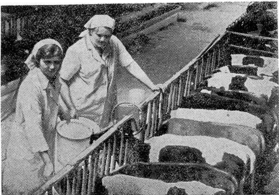
Белорусская ССР. В материалах июньского (1983 г.) Пленума ЦК КПСС указываются пути совершенствования производственных отношений — агропромышленная интеграция и развитие межколхозных и колхозно-совхозных объединений. Примером таких новых взаимоотношений является животноводческое предприятие совхоза «Красногвардейский» Минской области — одно из крупных поставщиков мяса. Здесь одновременно на откорме содержится 9 тысяч животных. А с выходом на проектную мощность их численность возрастет до 12 тысяч.