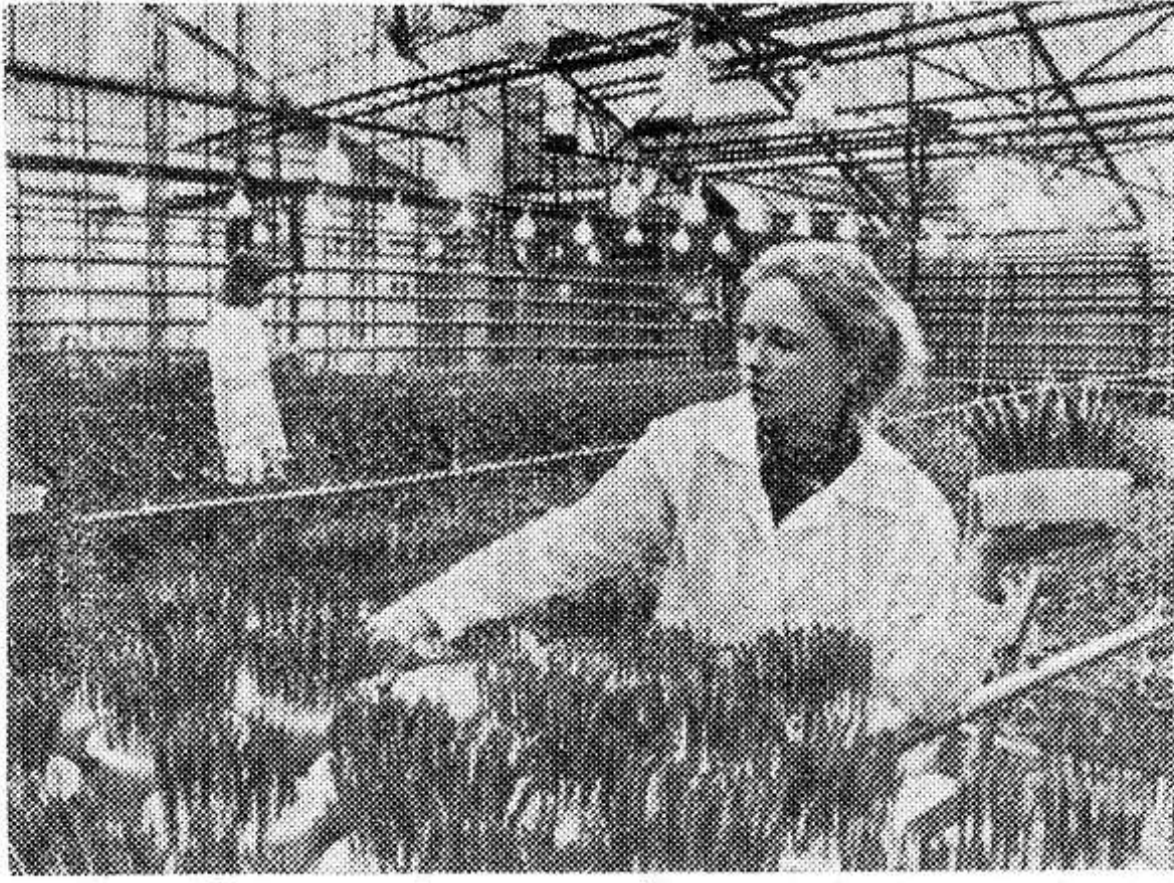
«Усилить работы по селекции новых сортов и гибридов сельскохозяйственных культур».

Киров. Ученые-селекционеры научно-исследовательского института сельского хозяйства Северо-Востока имени Н. В. Рудницкого за последние несколько лет передали на государственные сортоиспытания 46 сортов сельскохозяйственных культур. 12 из них, такие, как озимая рожь «голубка», яч-