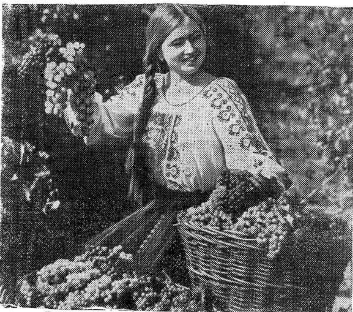
В сельском хозяйстве республики важное значение име- ют виноградарство и садоводство.