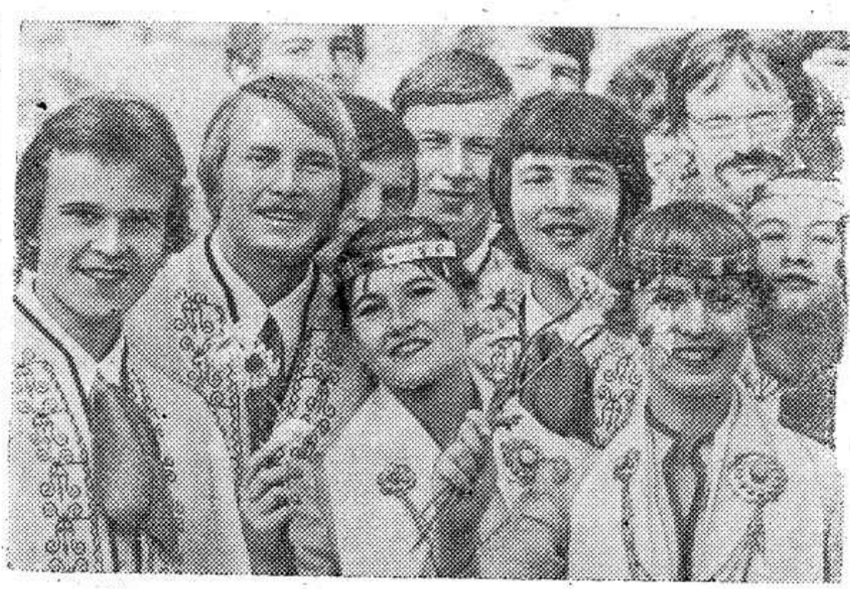
Участники самодеятельного танцевального ансамбля города Смилтене.

Мощная электрическая река, рожденная в янтарном краю совместным трудом советских людей, буквально вдохнула жизнь в сельское хозяйство республики.