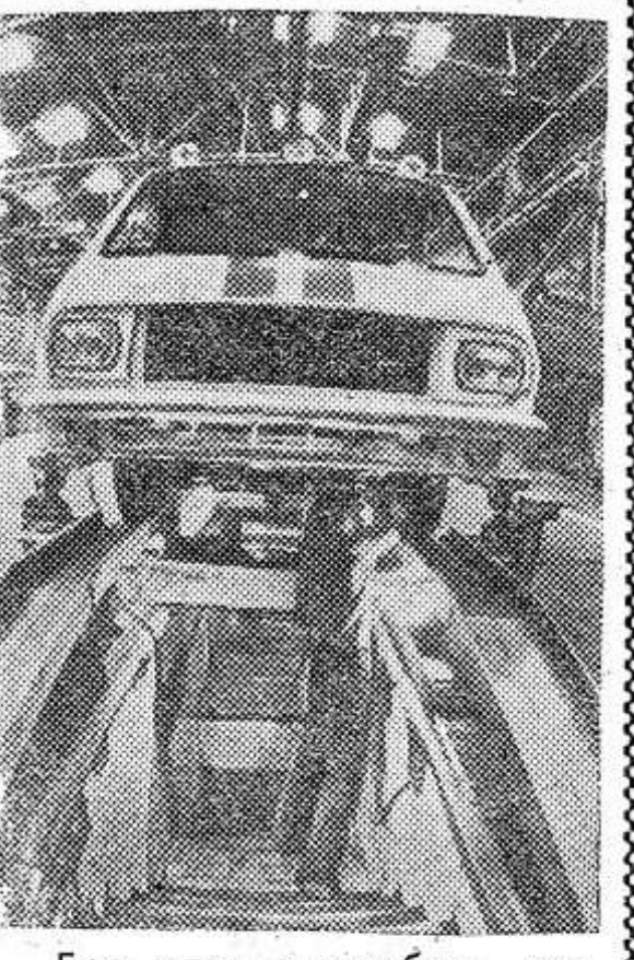
Еще один автомобиль сходит с заводского сборочного конвейера.

— Так получилось, что годы моего становления как актрисы совпали с годами становления моей республики, — говорит В. Артмане. — Интернационализм советской культуры раздвинул репертуарные рамки латвийского театра.