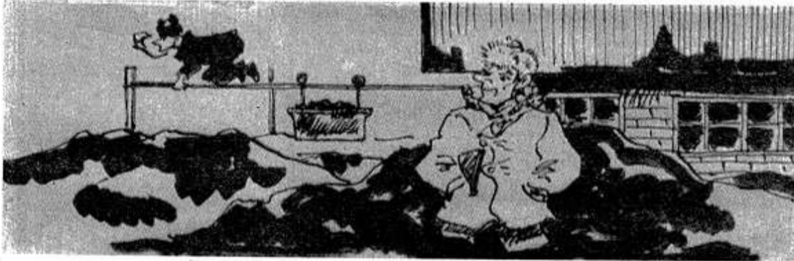
— Посмотрите, отряда из объединения «Сельхозтехника» не видно?

щего года вывезено менее двух тонн органических удобрений на один гектар пашни.