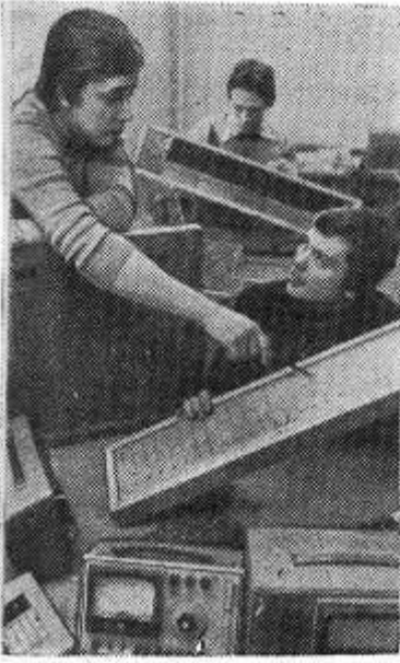
Московская опытно-экспериментальная фабрика «Агроросбие» Министерства сельского хозяйства РСФСР выпускает изделия более 1000 наименований. Это макеты сельских построек и сооружений, технические средства обучения, муляжи плодов и овощей.