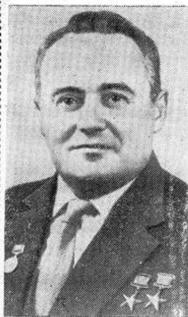
12 января 1982 года исполняется 75 лет со дня рождения С. П. Королева (1907 — 1966), советского конструктора ракетно-космических систем, дважды Героя Социалистического Труда, академика. НА СНИМКЕ: С. П. Королев.

Ряду работников просвещения вручены награды.