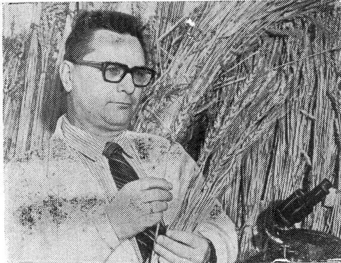
Ленинград. Агрофизический научно-исследовательский институт ВАСХНИЛ.

Ученые лаборатории биологии и радиобиологии растений под руководством