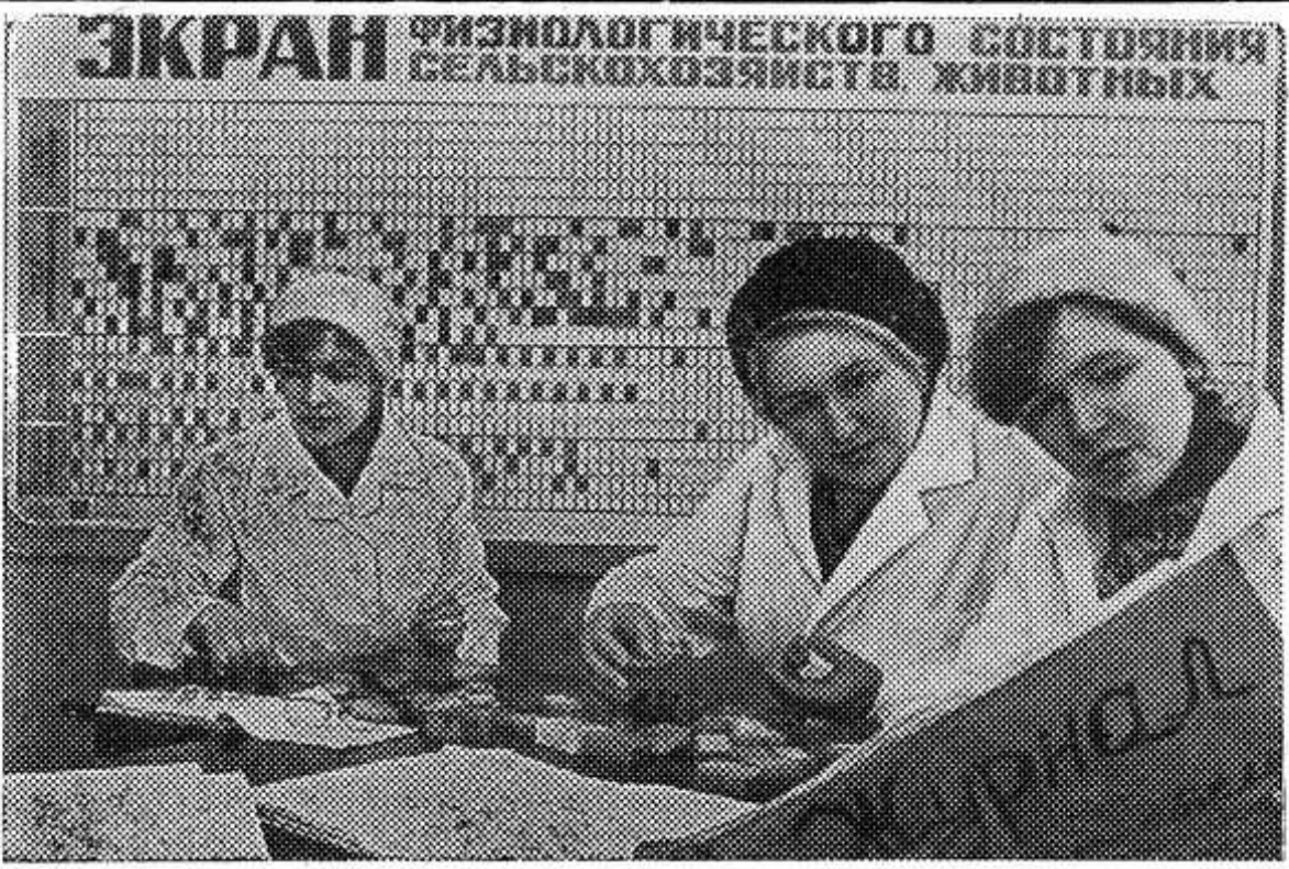
Животноводческий комплекс на 1200 коров опытно-производственного хозяйства «Заря» — самое

В последнее время прилагают много усилий для выполнения плана труженики откормочных ферм совхоза «Красный фронтовик». За 16 дней декабря они отгрузили на заготовительные пункты более 64 тонн мяса, что дало прибавку к выполнению годового плана 8 процентов, в то время, как в целом по району прибавка составила два процента.