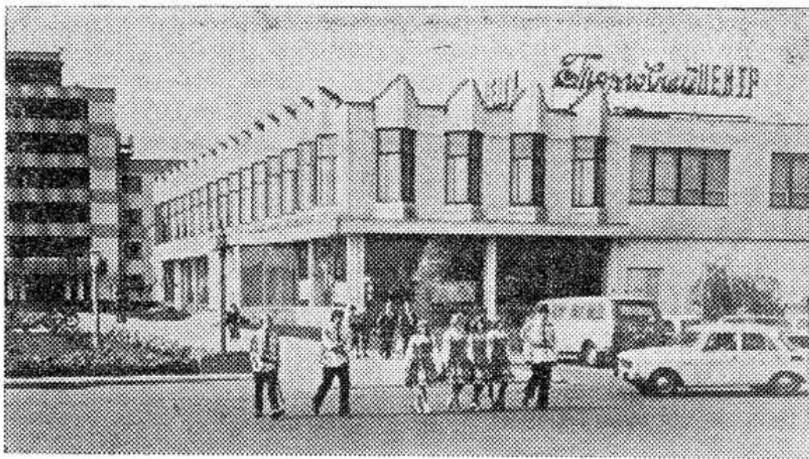
БЕЛОРУССКАЯ ССР. Вдоль широких асфальтированных улиц центральной усадьбы колхоза «Рассвет» имени К. П. Орловского Могилевской области — двух-

этажные коттеджи. Есть в них газ, горячая вода, удобные погреба, рядом — просторные гаражи для автомашин.