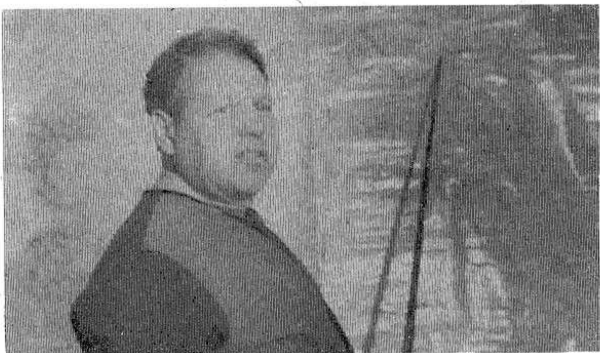
Повышение идейно-политического уровня работающих партийная организация автоколонны № 1300 рассматривает как одну из главных задач в формировании нравственного воспитания.

Этой цели прежде всего служит система партийной учебы и экономического образования, которой охвачено большинство водителей и ремонтного состава, инженерно-технического персонала и служащих.