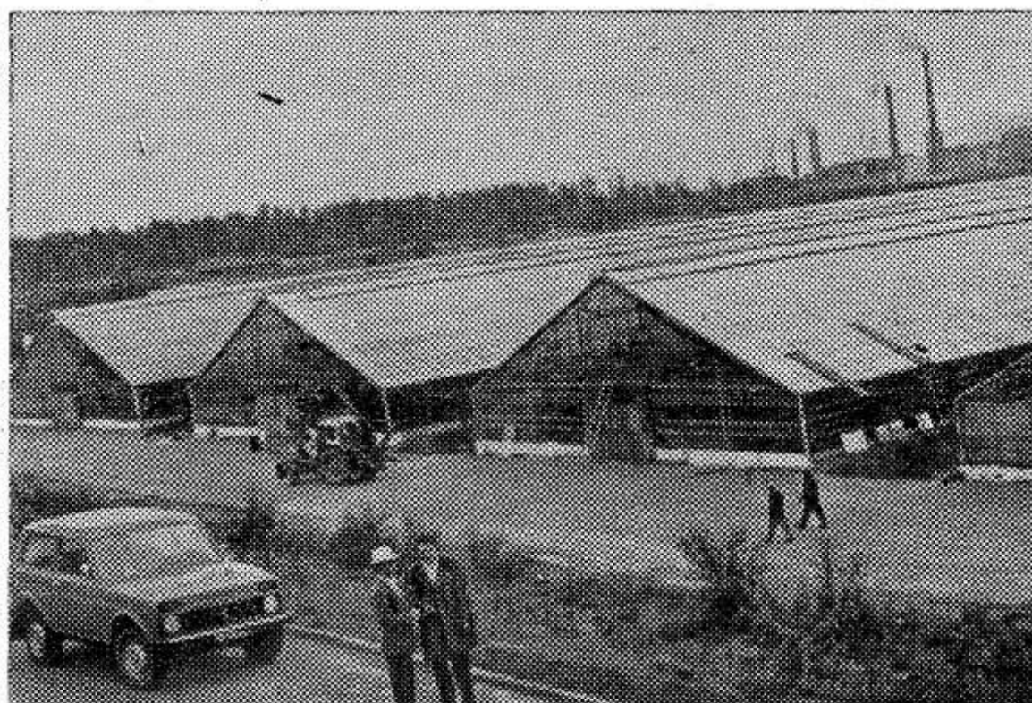
продовольственной базы. И она создается быстрыми темпами. Вблизи Братска уже ра-