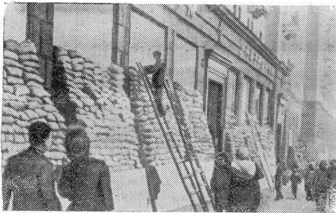
НА ВЕРХНЕМ СНИМКЕ: улица Горького в 1941 году. Витрины магазинов закрыты мешками с песком на случай бомбежки.