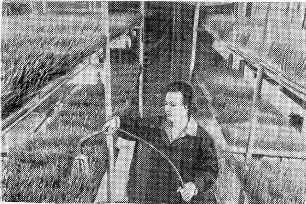
В совхозе «Новгородский», самом крупном в Новгородской области хозяйстве по откорму свиней на промышленной основе, налажено выращивание зеленой массы гидропонным методом. Витаминная подкормка стала постоянным компонентом в рационе молодняка.

Гидропонное отделение кормоцеха занимает 200 квадратных метров. На стеллажах в три яруса размещены 800 поддонов, в которых выращивается «зеленка». Ежедневный урожай — 500 килограммов зеленой массы.