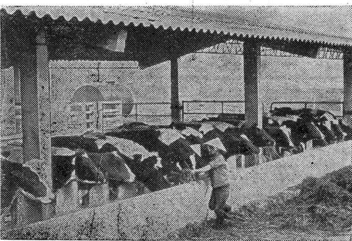
ВЬЕТНАМ. При содействии кубинских специалистов в провинции Шонла построена крупная животноводческая ферма на 1800 коров (на снимке).