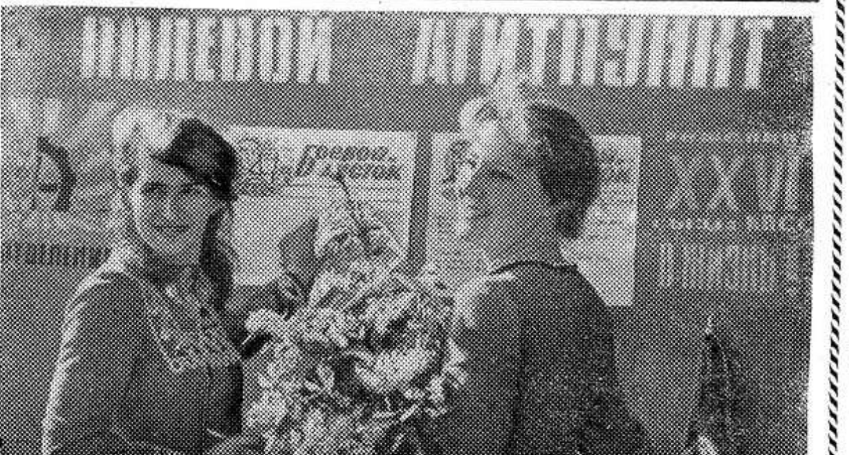
АЛТАЙСКИЙ КРАЙ. Хорошо работало звено идеологического обеспечения на севе в колхозе «Россия» Змеиногорского района. В образцовом состоянии наглядная агитация, с помощью местного радио и стенной печати обеспечивается

В числе первых хозяйств, уже ощутивших пользу новшества, — латвийский колхоз «Наукушени», опытно-производственное хозяйство «Дотнува» (Литва) и ряд других. В другой климатической зоне — Киргизии инициаторами стали труженики села Таласского района. Сейчас механизированные комплексы для протравливания семян построены уже в 22 хозяйствах района. В экспозиции подробно показан опыт колхоза «Октябрь» Ала-Букинского района этой же республики. Если до постройки механизированного пункта расходы на предпосевную обработку здесь превышали 5 рублей на тонну, то теперь они снизились втрое. (Корр. ТАСС).