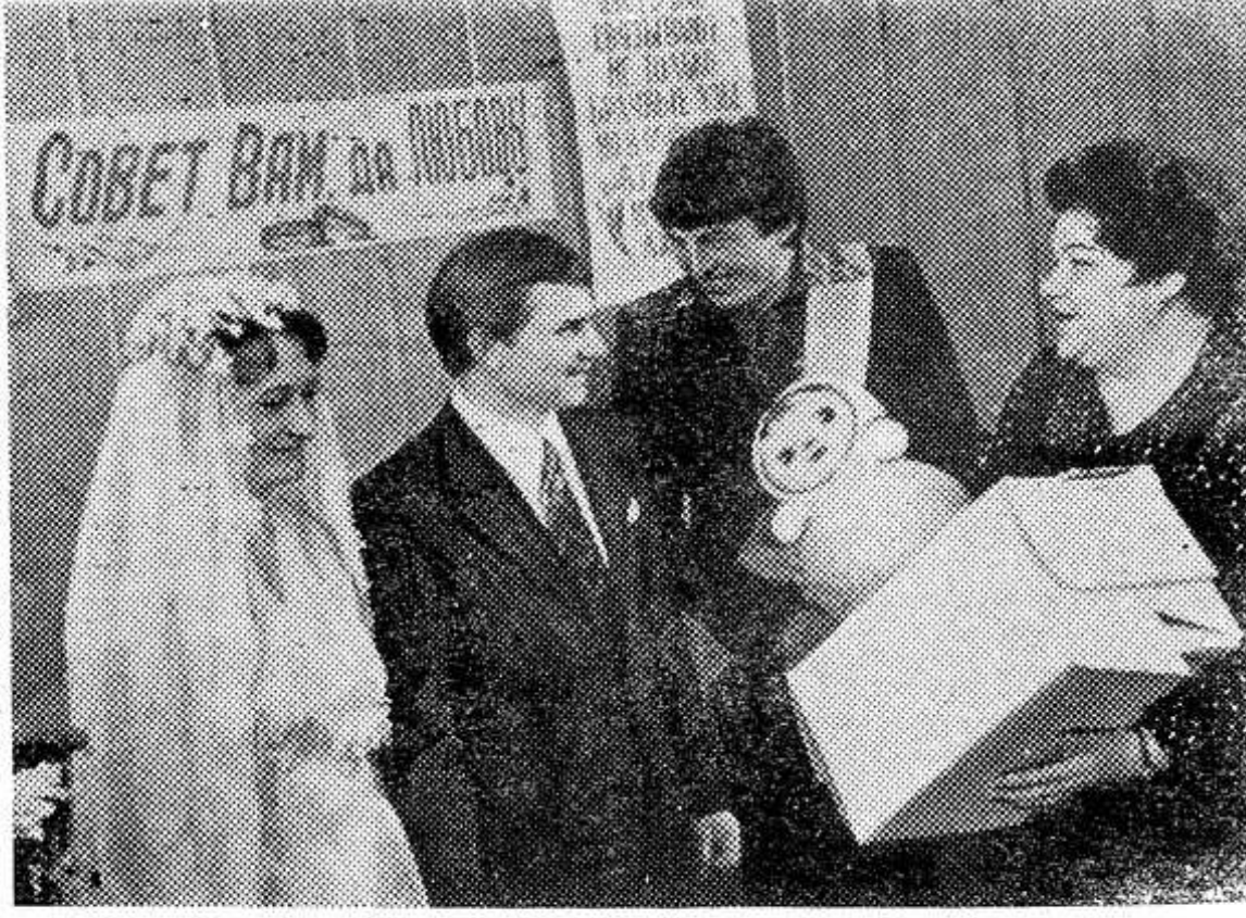
Овощеводы, доярки, механизаторы регулярно приходят к ребятам.

В хозяйстве заботятся о трудовой смене и прививают молодежи любовь к земле со школьной скамьи.