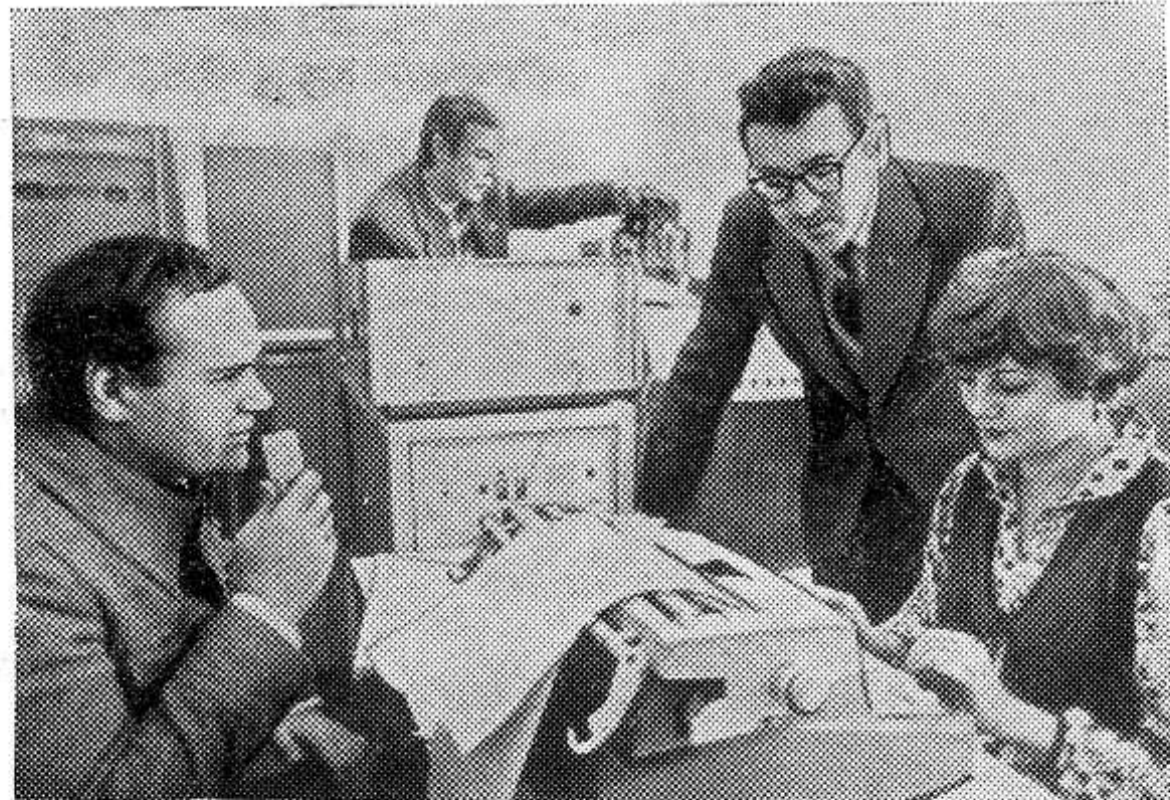
МОСКОВСКАЯ ОБЛАСТЬ. На кафедре при- менения электрической