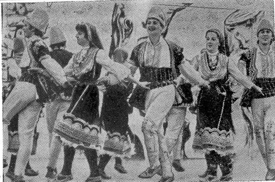
Болгария. Свыше 500 тысяч человек участвуют в художественной самодеятельности. Семь оперных театров, десятки профессиональных ансамблей, сотни коллективов художественной самодеятельности хранят и приумножают богатое творческое наследие болгарского народа.

Высокий исполнительский уровень болгарских певцов и танцоров завоевал международное признание.