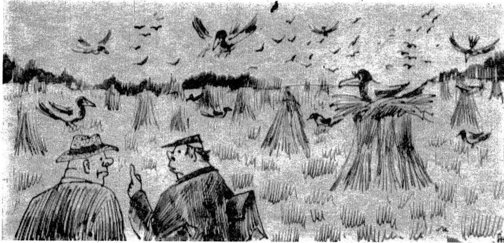
— А говорят, на наших полях никого нет.

реводе на волокно. Немного лучше положение и в других хозяйствах района. А пора бы уже по-настоящему взяться за дело.