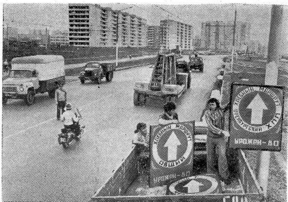
ОРЕНБУРГ. Служба ГАИ области — это отряд высококвалифицированных специалистов, организующих дорожное движение с помощью самых современных технических средств. Надзор за движением транспорта и пешеходов осуществляют сотни выносных, мужественных инспекторов дорожно-патрульной службы, тысячи активистов,

дружинников, юные инспекторы движения. Обеспечивая образцовый порядок на дорогах, они создают условия для повышения эффективности пассажирских и грузовых автомобильных перевозок.