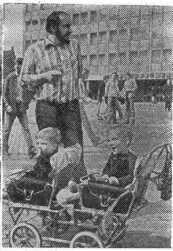
ческого государства на международной арене. НА СНИМКАХ: в торговой части Берлина — столицы ГДР. Молодежь и дети — будущее страны. (Фотохроника ТАСС).

стических стран добились замечательных успехов в развитии экономики, науки и культуры, в формировании человека нового общества, в укреплении позиций и авторитета немецкого социали-