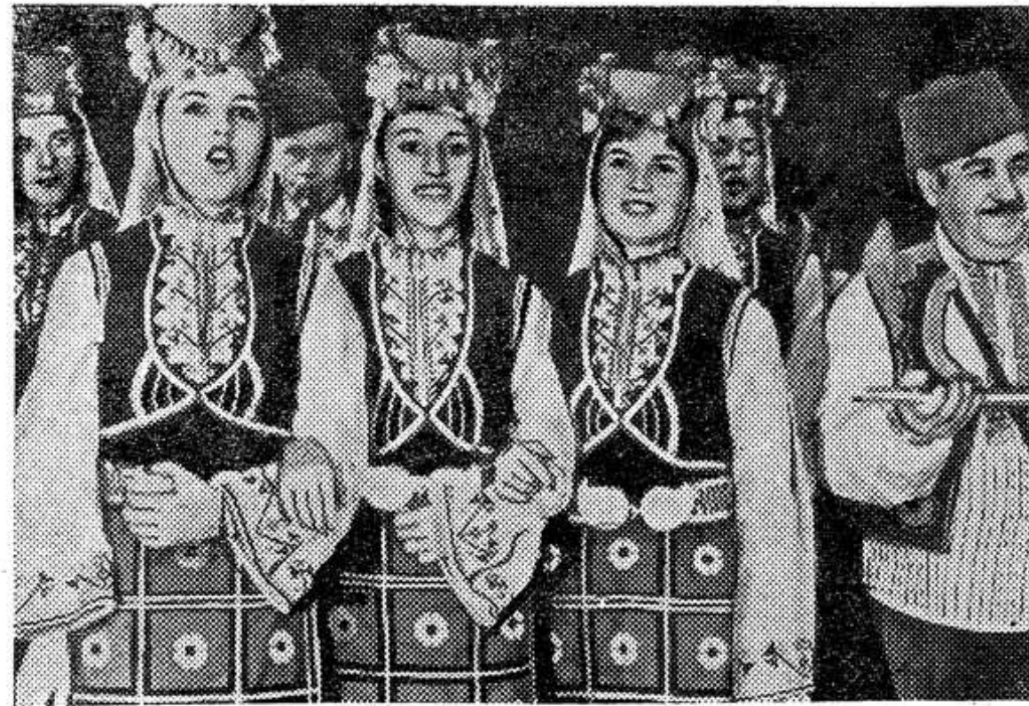
Двадцать тысяч коллективов художественной самодеятельности создано в Народной Республике Болгарии. В работе хоров, оркестров, танцевальных ансамблей, театров и кружков изобразительного искусства участвуют люди всех возрастов и профессий.

Правительство Австралии ввело в этом году новые паспорта, в которых граждан, выезжающих за границу, предостерегают от употребления наркотиков, а тем более попыток везти их в страну. Наркомания давно уже стала острой проблемой на «пятом континенте», и новый паспорт — признание де-факто ее общенациональных масштабов.