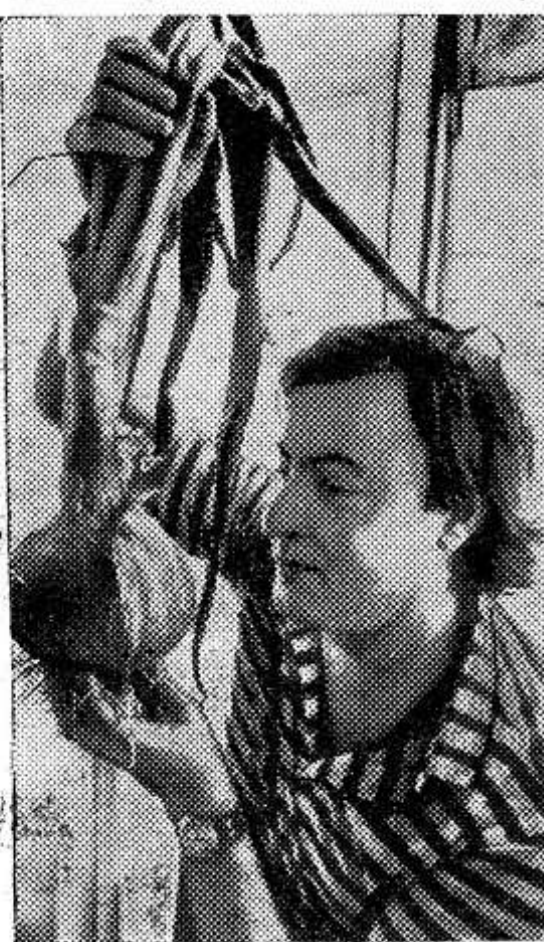
900 граммов — таков вес необыкновенной луковичы, выращенной в одном из сельских районов недалеко от города Бильбао (Испания).

В штате Керала на юге Индии неосторожно «переходившая» дорогу кобра вызвала аварию, в результате которой 3 человека погибли и 7 получили ранения. Кобра занимает почетное место в индуистской мифологии, свято почитается в сельской местности. Неудивительно, что шофер грузовика, увидев распластавшуюся посреди дороги змею, резко нажал на тормоза—грузовик с людьми перевернулся.