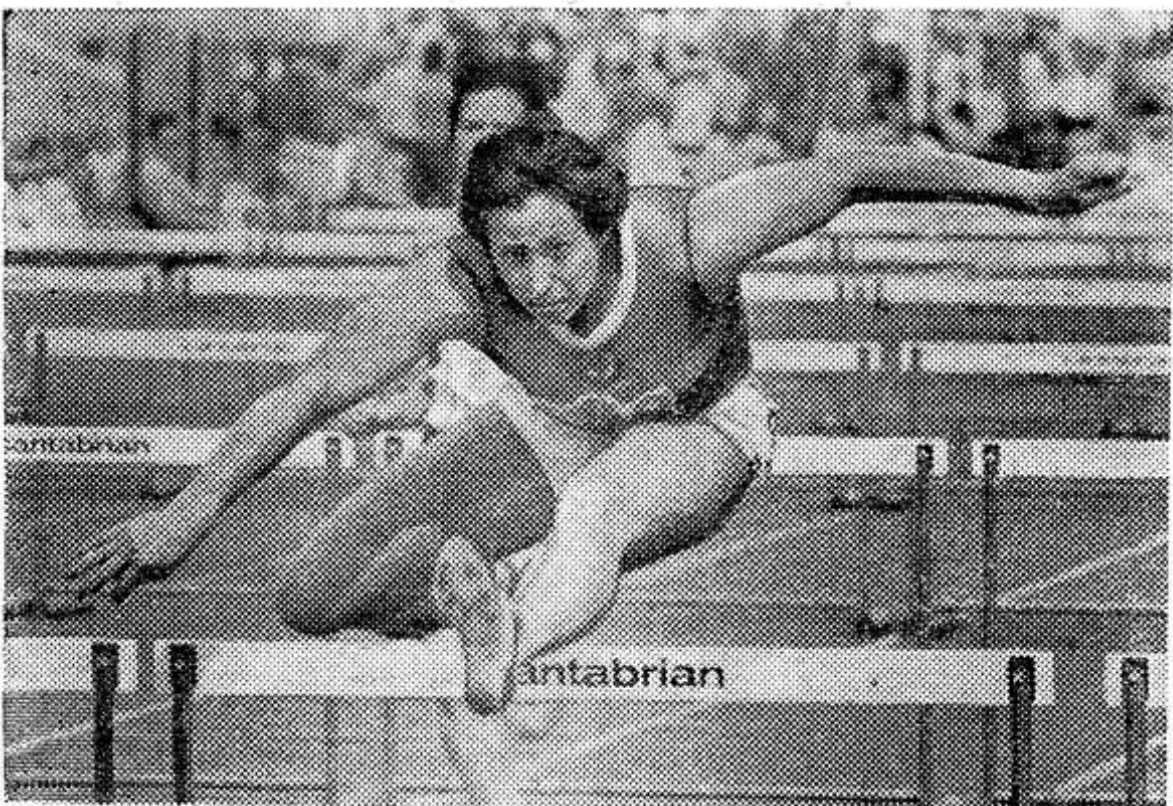
МОСКВА. Большая спортивная арена Центрального стадиона имени В. И. Ленина.

Легкая атлетика. Пятиборье. Женщины. Олимпийский и мировой рекорд в