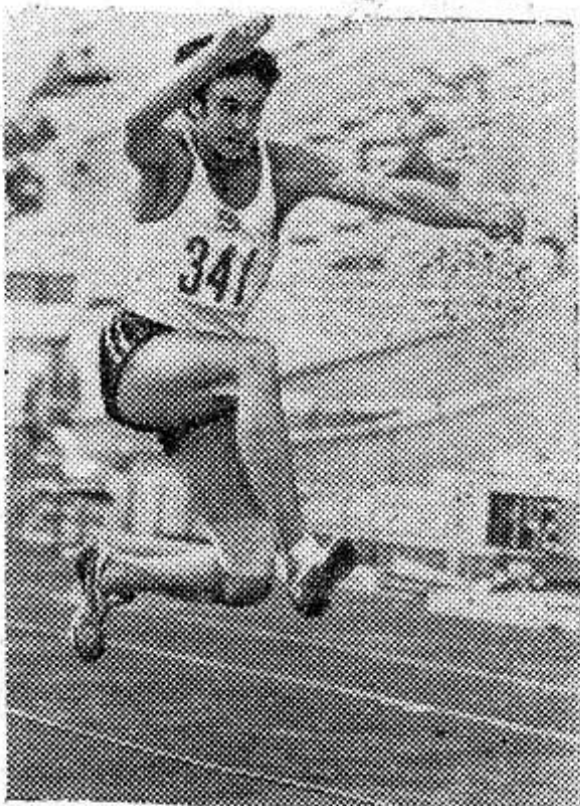
Трехкратный олимпийский чемпион Виктор Санеев стал серебряным призером Олимпиады-80.