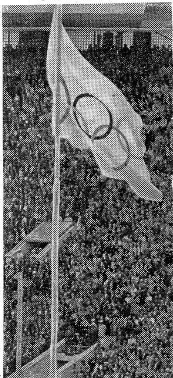
На флагштоке Центрального стадиона имени В. И. Ленина — Олимпийский флаг.