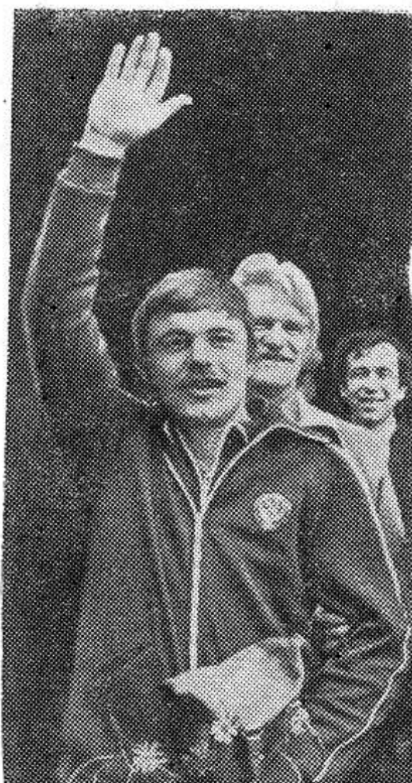
Первый чемпион Олимпиады в стрельбе из произвольного пистолета Александр Мелентьев. Его результат 581 очко — новый олимпийский и мировой рекорд.