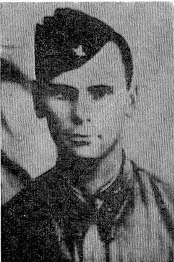
жизни, их именами названы улицы.