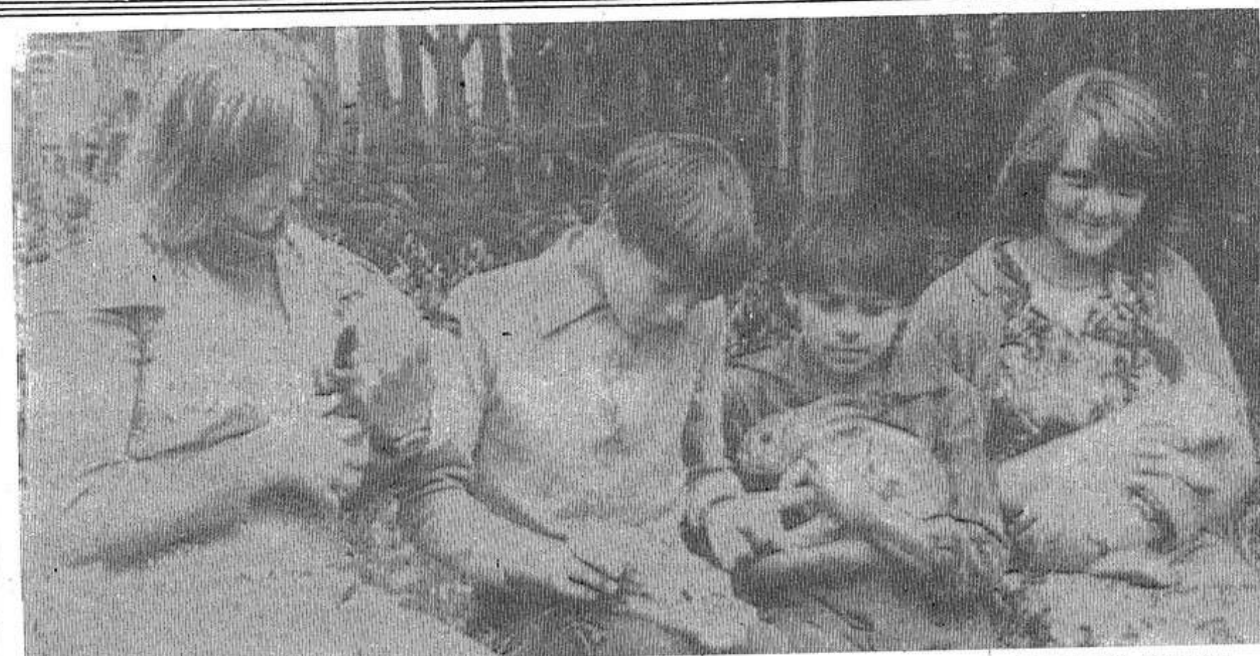
НА СНИМКЕ: юные кролиководы школы-интерната.