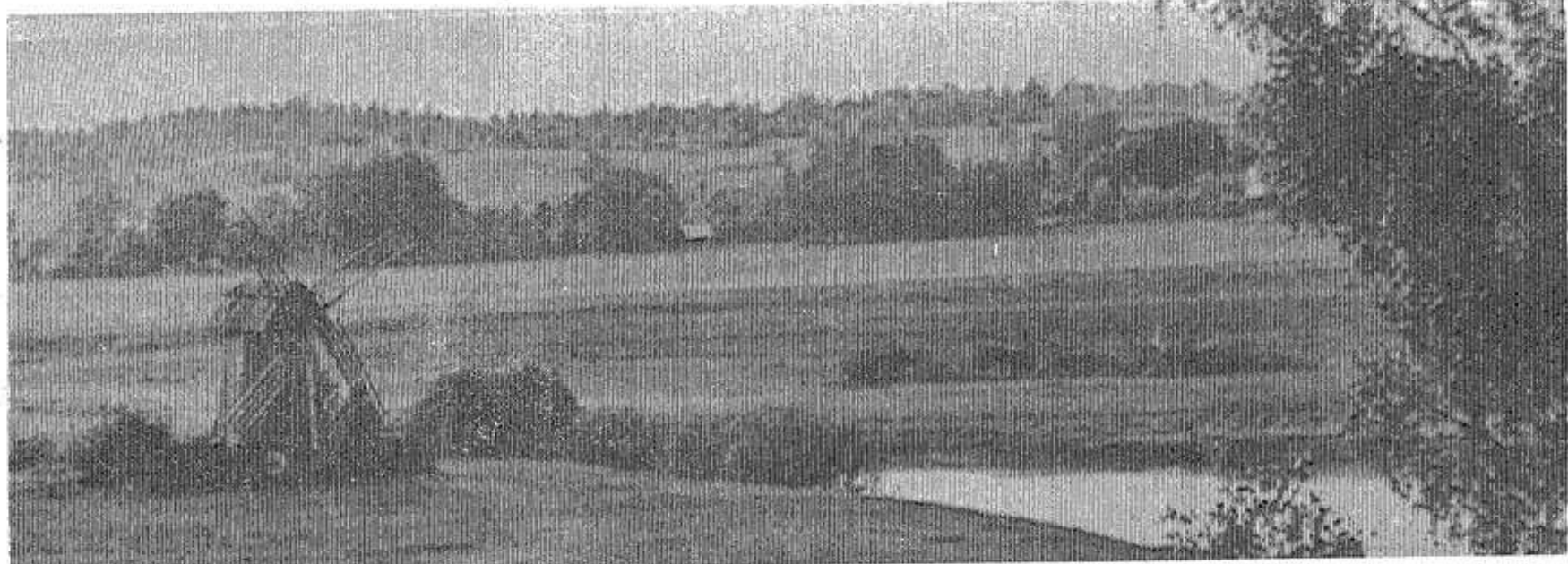
В окрестностях Михайловского.