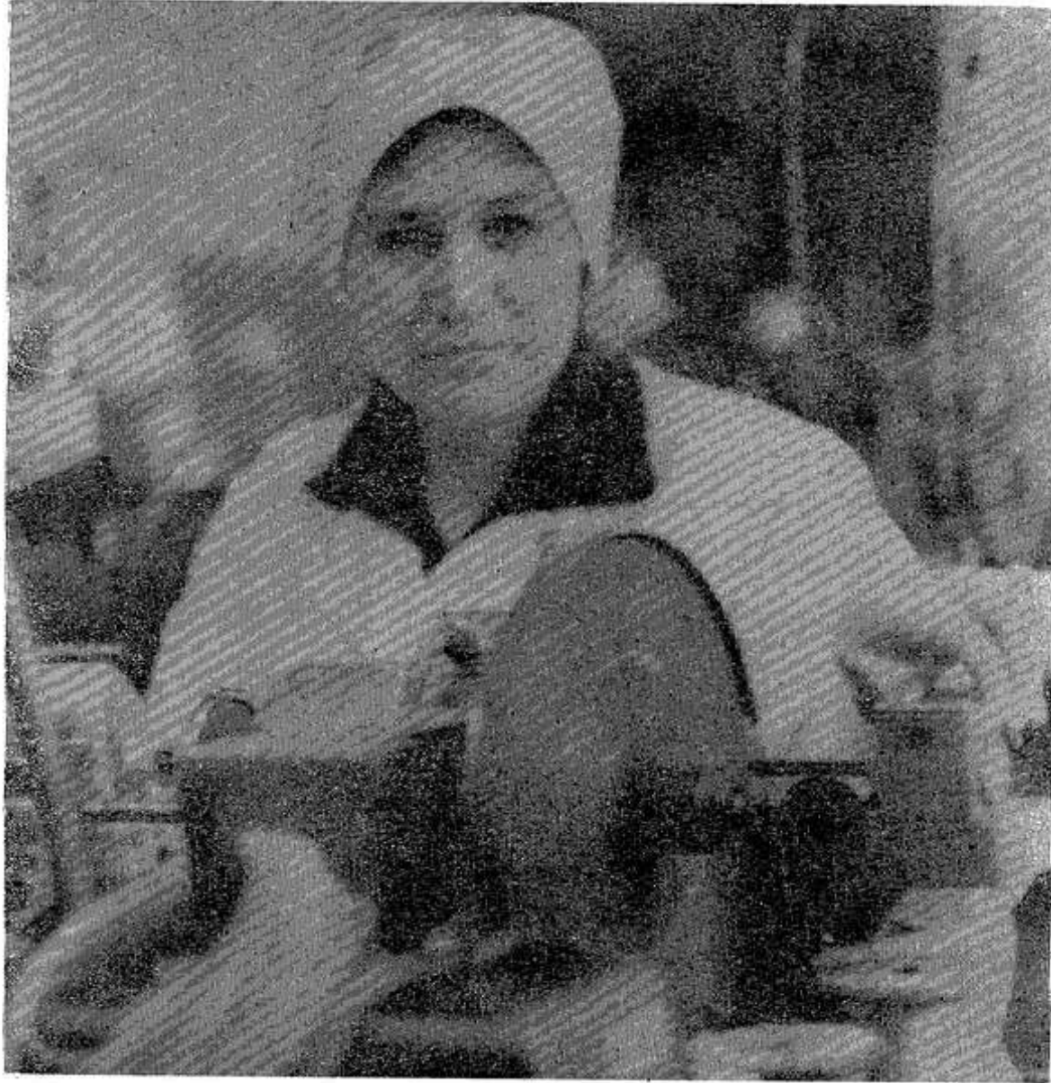
В конце 1979 года комсомолка рапортовала о большой трудовой победе, выполнив пятилетний план.

Секретарь ежегодно подтверждает высокое звание ударника коммунистического труда.