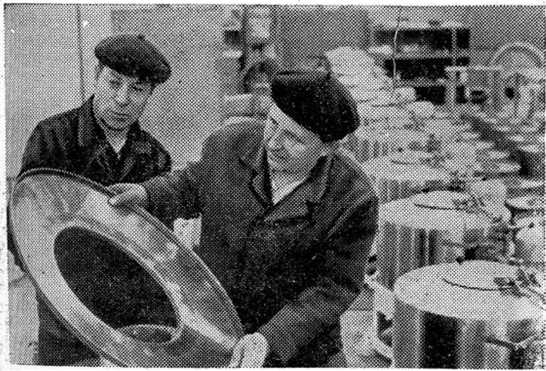
МОСКВА. Коллектив Московского экспериментального машиностроительного завода