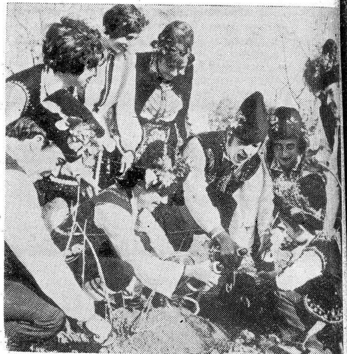
НРБ. С песнями, в ярких национальных костюмах вышли на виноградные плантации работники агропромышленных комбинатов, крестьяне-кооператоры. Начались работы по обрезке виноградной лозы — так ежегодно отмечается в Болгарии День виноградаря. В настоящее время план-

Температура воздуха ночью 9—14 градусов мороза, местами 14—19 градусов, днем 1—6 градусов мороза. Завтра характер погоды сохранится.