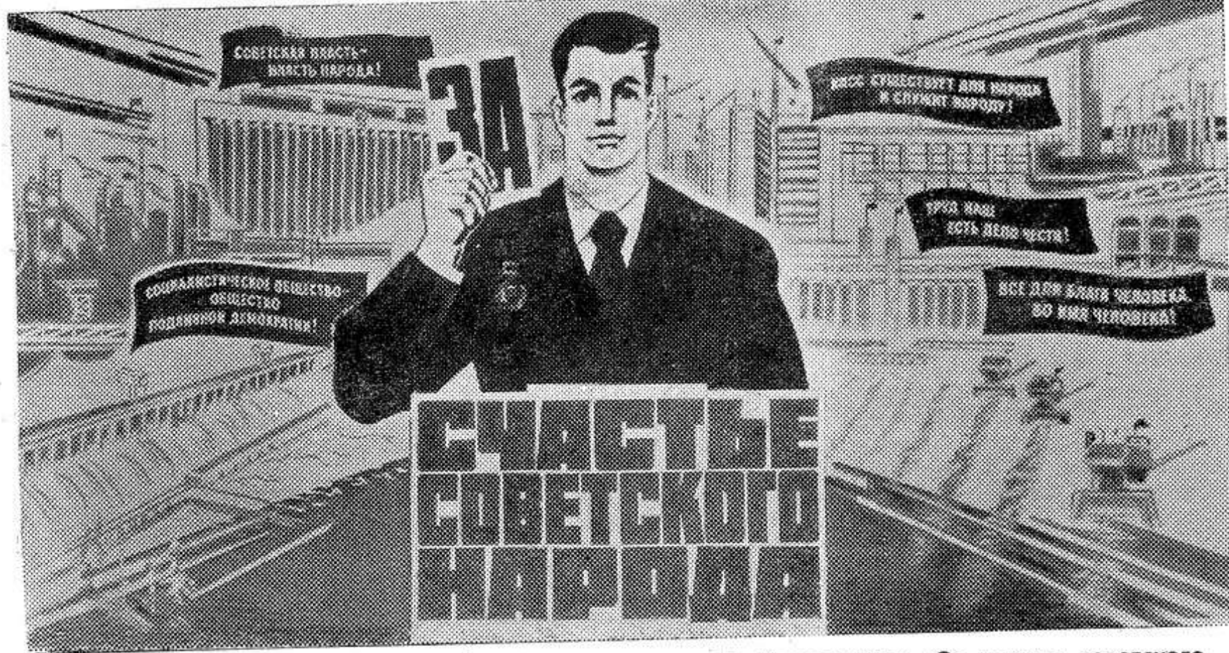
Плакат художника Б. Решетникова «За счастье советского народа». Издательство «Плакат».

Отдадим свои голоса за кандидатов нерушимого блока коммунистов и беспартийных!