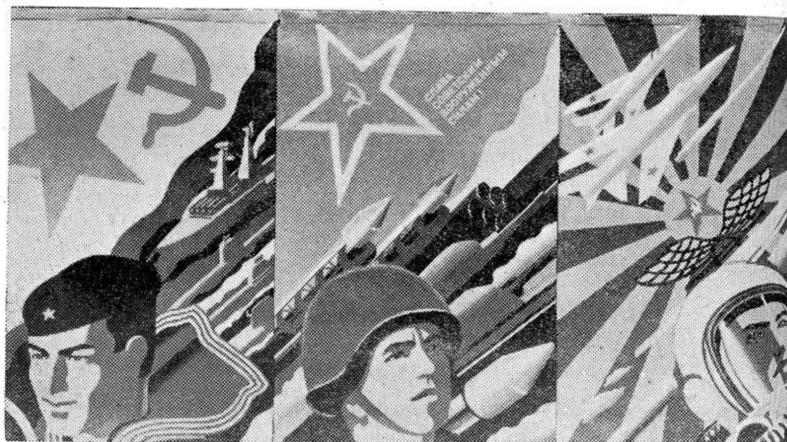
Плакат художника А. Арсеньева «Слава Советским Вооруженным Силам!» Издательство «Плакат».