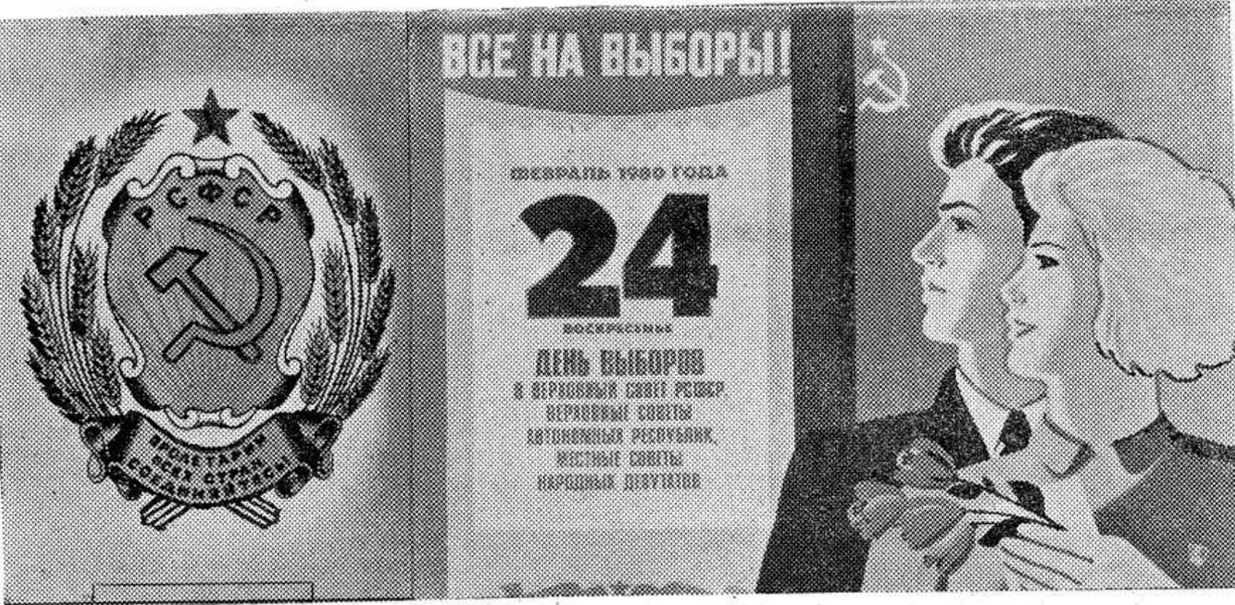
Плакат художника М. Гетмана. Издательство «Плакат».