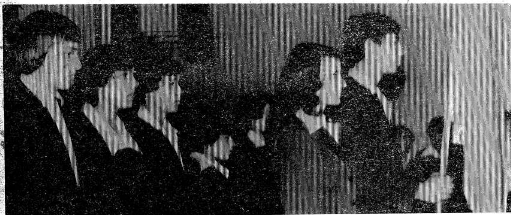
Участников слета приветствуют учащиеся профтехучилищ.

Переходящий красный вымпел присужден полеводческой бригаде совхоза