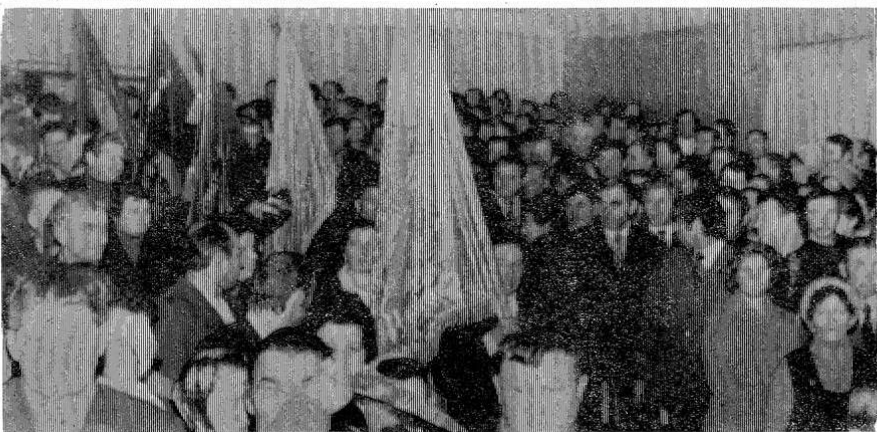
В зале — передовики производства. Вносятся трудовые знамена.

И вот зал заполнен. Здесь собралось 480 человек. Это передовики производства промышленных предприятий города, строительных и транспортных организаций, торговли, колхозов и совхозов, руководители, инженерно-технические работники, специалисты сельского хозяйства, секретари первичных парторганизаций.