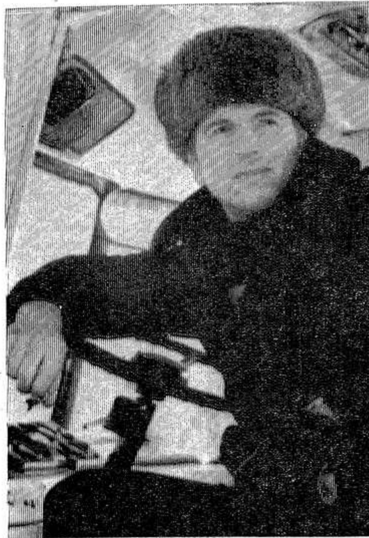
армией приобрел еще одну нужную для села профессию — шофера. Этому делу обучался в Пушкиногорской школе ДОСААФ.