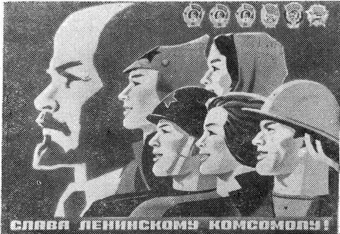
Плакат художника И. Коминарца. Издательство «Плакат».