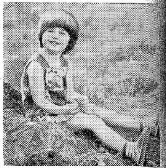
Машенька. Зам. редактора Ф. Е. АНИТОВ