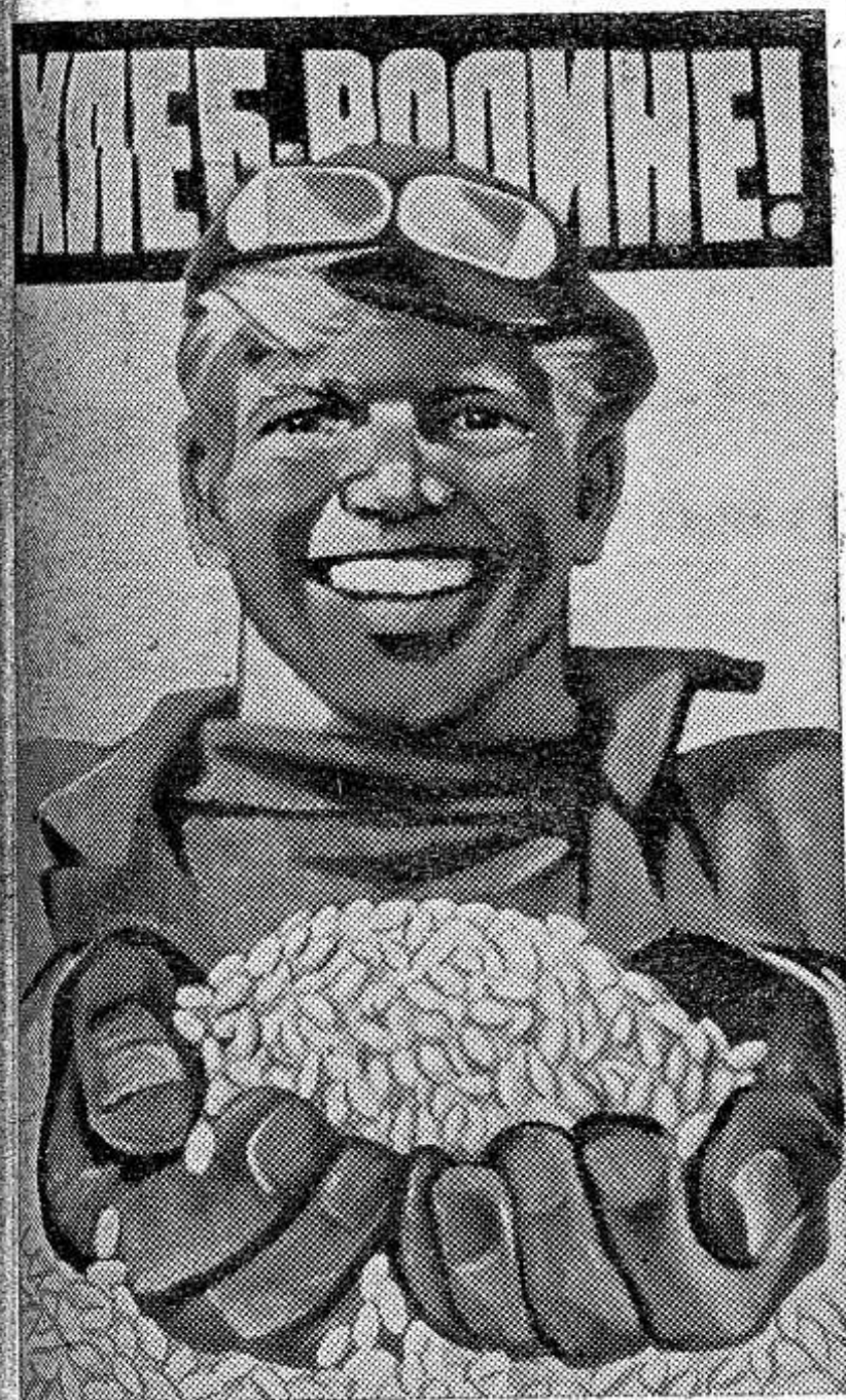
Плакат художника В. Кононова. Издательство «Плакат».

Из общего количества разостланного льна 60 процентов поднято со стлещ. Продано же на завод колхозами и совхозами района только 30 тонн тресты в переводе на волокно. Это очень мало. Ведь в районе проходит ударный месячник по уборке, подъему льнотресты со стлещ и отгрузке ее на завод. Нельзя допустить, чтобы выращенная продукция попала под снег и подверглась порче.