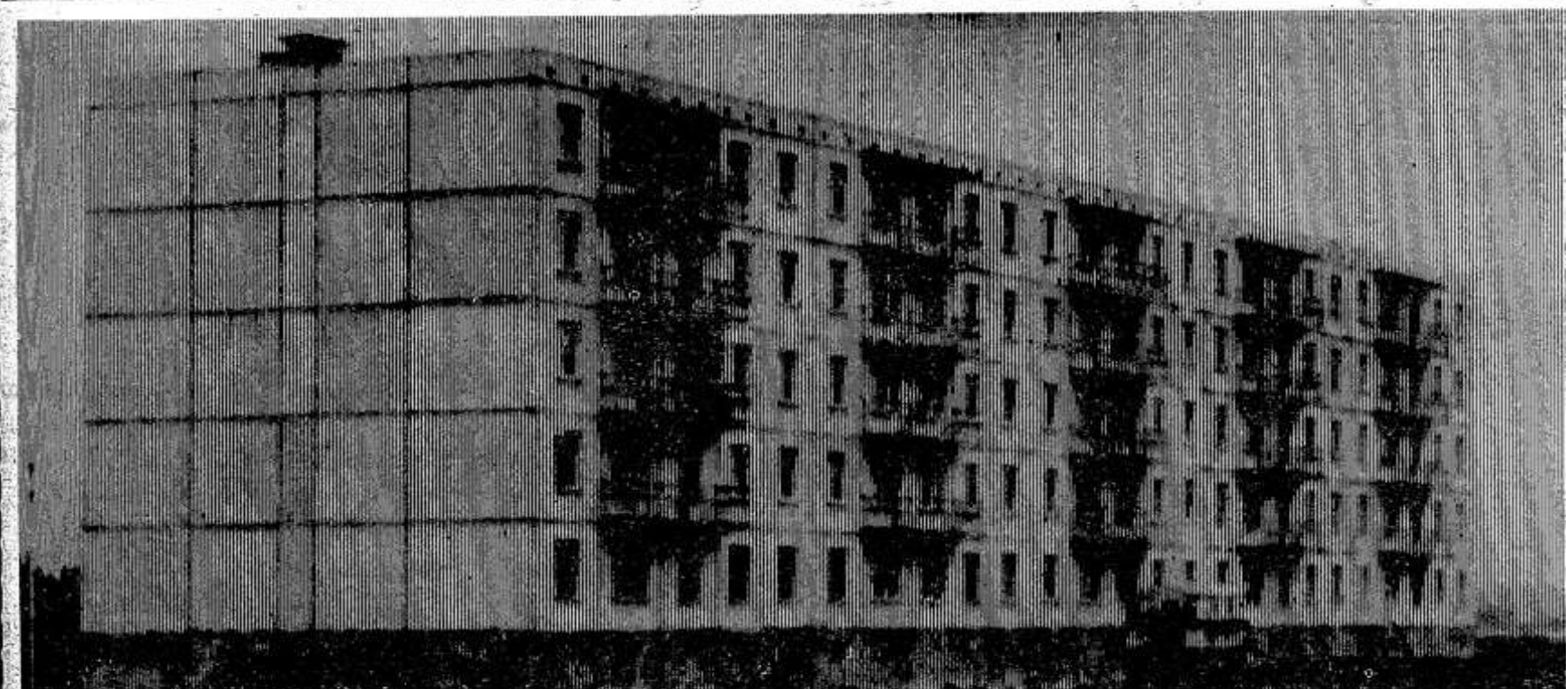
НА СНИМКЕ: новый жилой дом мелiorаторов.

Вот и ходят мелiorаторы по инстанциям, просят, уговаривают, требуют, а дело с места так и не трогается. Навоз лежит в яме у фермы, разбрасыватели стоят во дворе специализированного отделения, а на мелiorированные поля пока не внесено ни одной тонны органики.