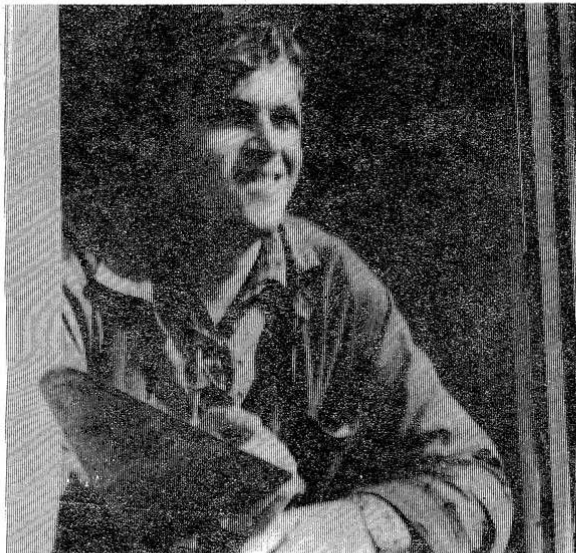
Строители только что отметили свой профессиональный праздник — День строителя. В коллективах отмечались передовики.

Л. ДМИТРИЕВ, звеньевой-комбайнер, член КПСС.