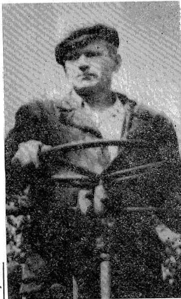
ранний картофель, убрать до 20 августа.

Большую помощь в копке картофеля нам оказывают шефствующие организации города. Рассчитываем площади, отведенные под