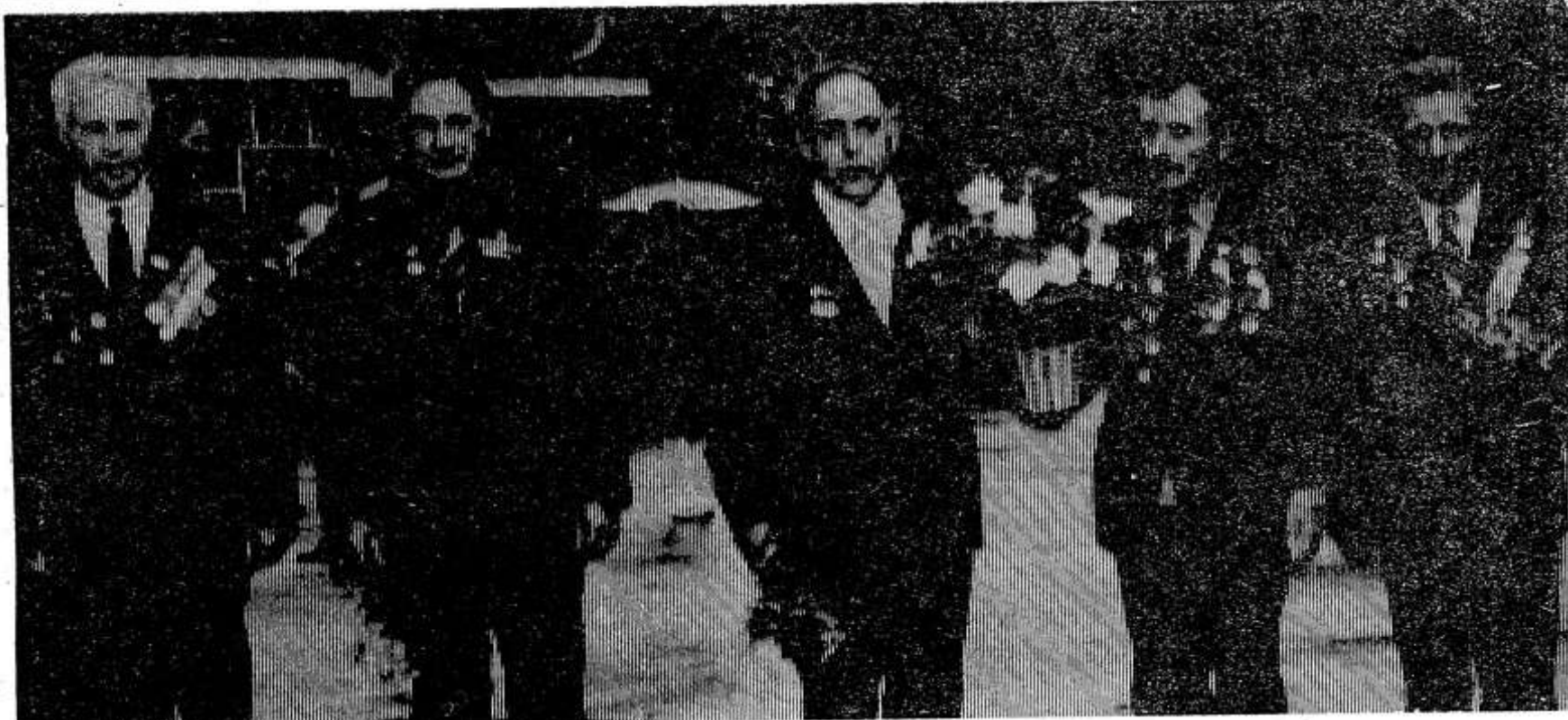
На снимке: возложение цветов к мемориальной доске в честь освободителей города и района.