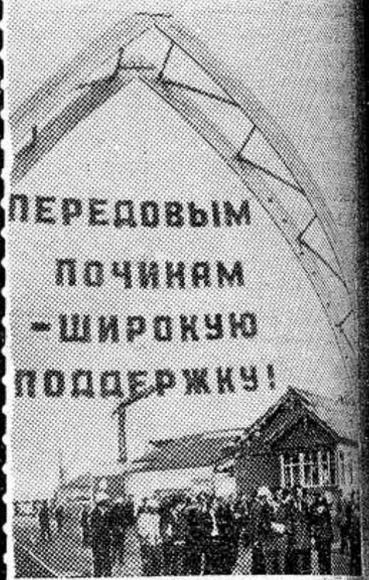
ПЕРЕДОВЫМ ПОЧИНАМ — ШИРОКУЮ ПОДДЕРЖКУ!

Ивановская область. В районном центре Тейково на комбинате производственных предприятий «Исельстрой» развернута выставка прогрессивных конструкций для сооружения животноводческих помещений и жилых домов в Нечерноземной зоне РСФСР. Первые ее посетители — участники семинара обмена опытом организаторской работы по обеспечению ускоренного строительства на селе. Семинар был организован Советом Министров РСФСР, Ивановским обкомом КПСС, Минсельхозом и Минсельстроем СССР.