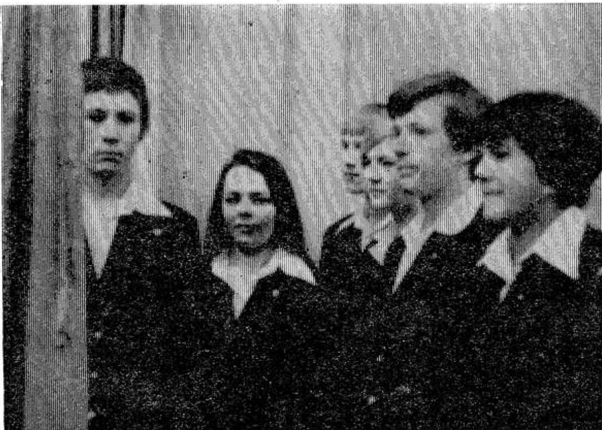
На снимке: будущие строители, учащиеся ГПТУ-6.

Е. ИВАНОВА, заведующая Болгатовской сельской библиотекой.