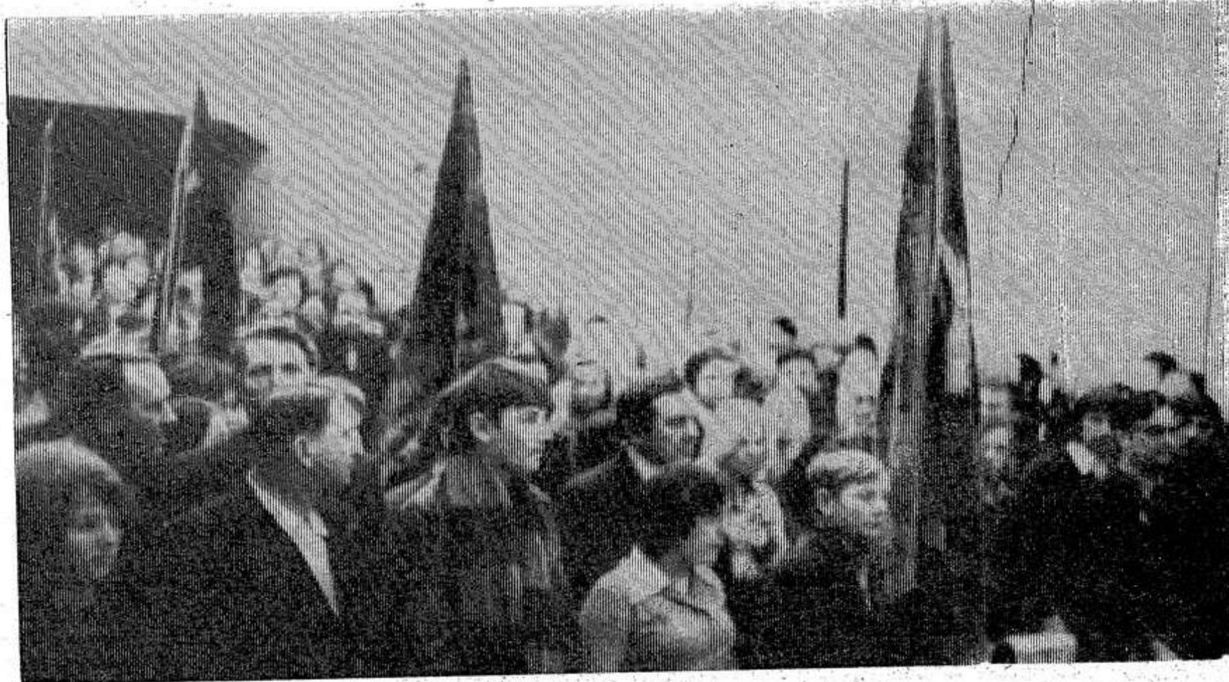
В зал слета вносятся трудовые Красные знамена.

В истекшем году под картофель было занято 1950 гектаров — 5 процентов пашни. Посевы этой культуры в основном сосредоточены в колхозах «Большевик», «Вперед» и «Заветы Ленина», совхозах «Глубоковский», «Красный фронтовик» и «Опочецкий». Победителем в соревновании за высокие урожаи картофеля вышел совхоз «Опочецкий».