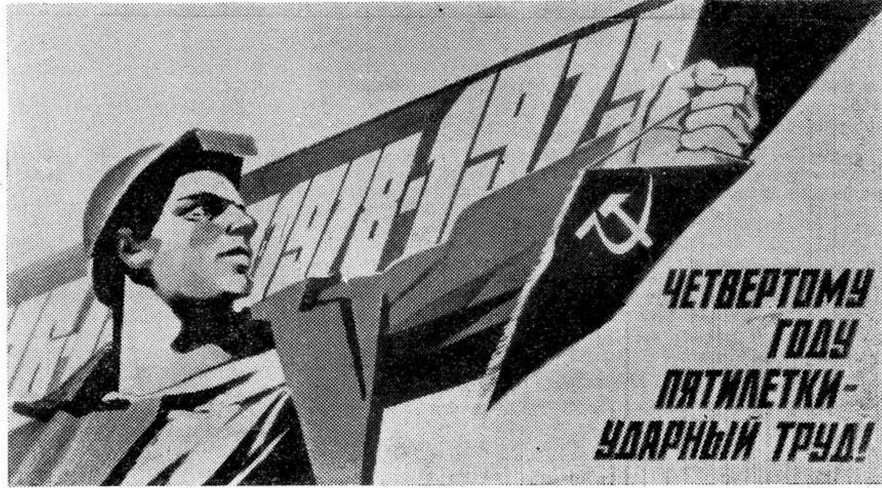
Плакат художника В. Кононова «Четвертому году пятилетки — ударный труд!». Издательство «Плакат».