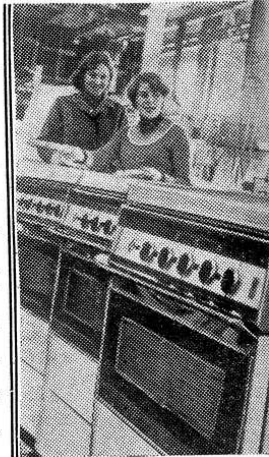
Белорусская ССР. Завершена реконструкция основного производства Брестского завода «Газоаппарат». Предприятие приступило к выпуску более совершенных газовых плит. Они снабжены системой блокировки газа, автоматической регулировкой высоты пламени, подсветкой в духовом шкафу. НА СНИМКЕ: на конвейере газовые плиты новой конструкции.

Ознаменуем выборы в Верховный Совет СССР новыми достижениями в труде и учебе.