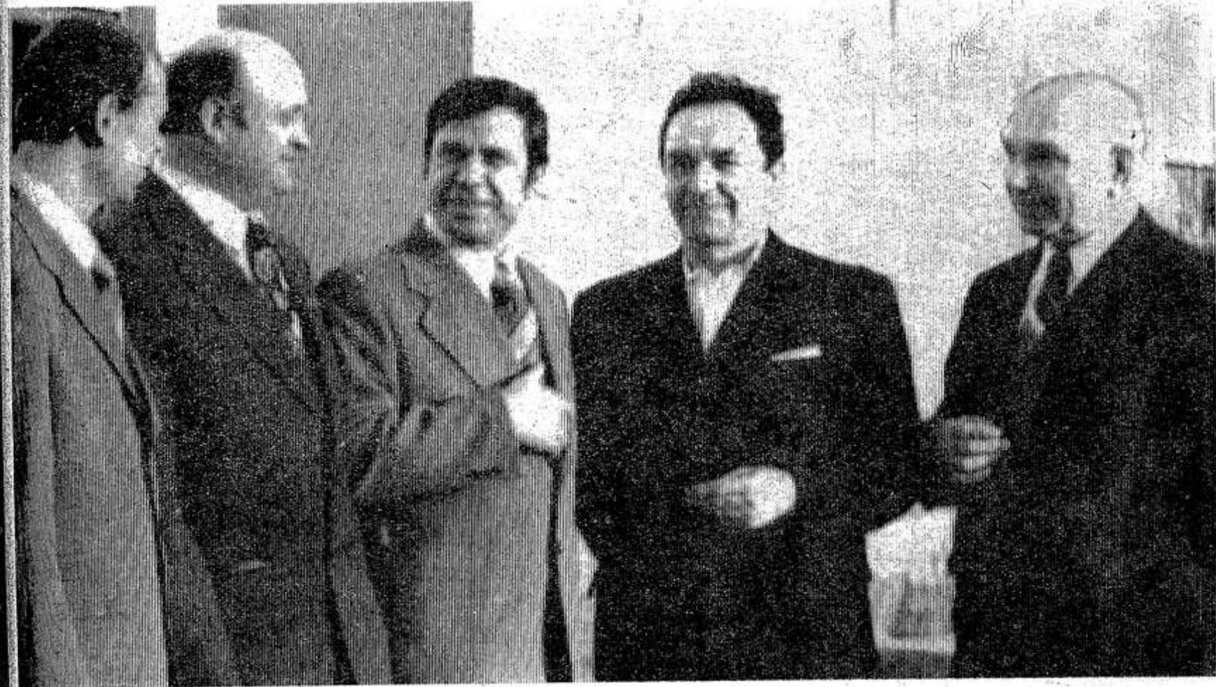
НА СНИМКЕ: делегаты конференции от парторганизации автоколонны № 1300.

XXII районная партийная конференция проходит в период, когда борьба за выполнение исторических решений XXV съезда партии, десятого пятилетнего