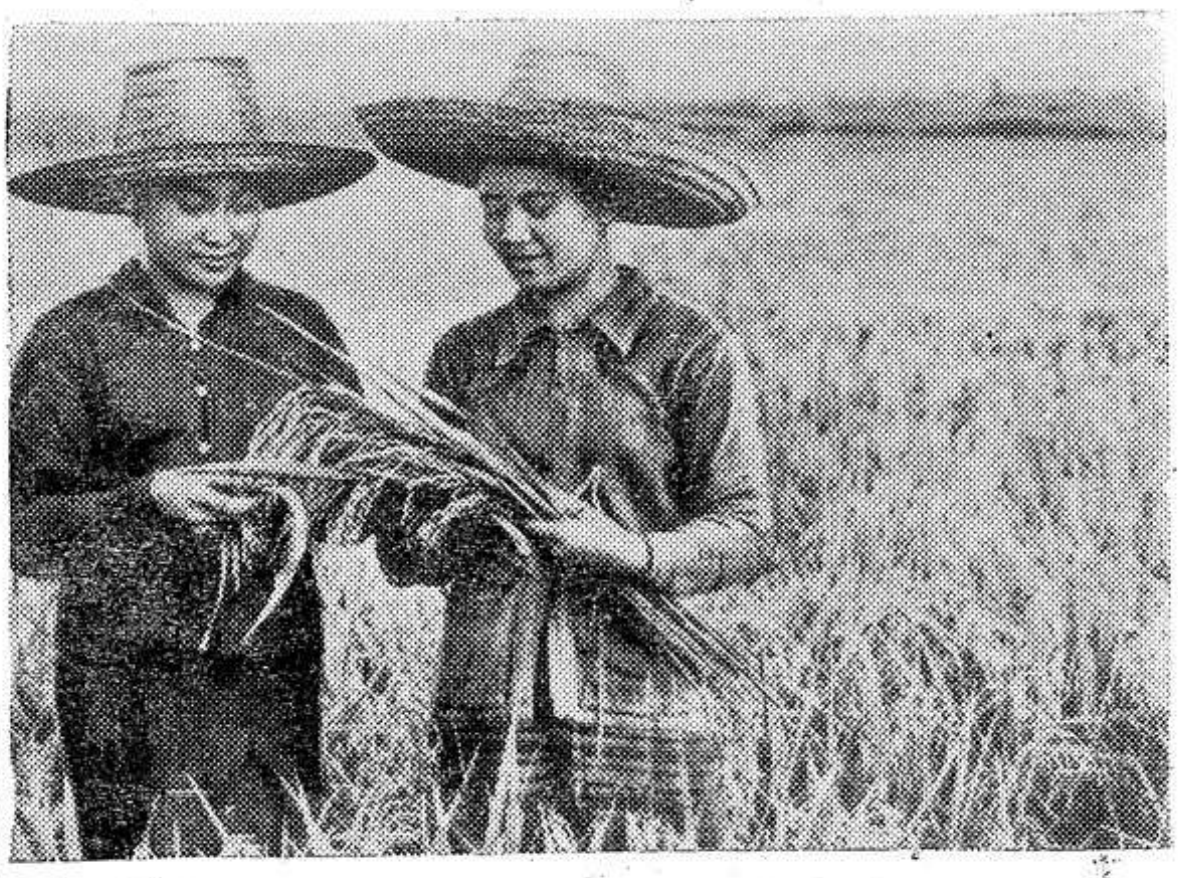
ЛАОС. Сельские труженики страны активно борются за успешное проведение сельскохозяйственных работ: заканчивают уборку урожая, готовят к севу культуры осенне-зимнего периода, расширяют пахотные земли и заготавливают корм для скота.