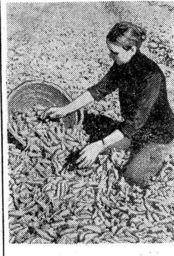
«Красным золотом» называют в Венгрии паприку, без которой не обходится приготовление многих блюд национальной кухни. Выращивание душистого перца сосредоточено в двух крупных районах на юге республики. Общая площадь, отведенная под эту культуру в госхозах и кооперативах, превышает десять тысяч гектаров. Паприка экспортируется в 35 стран мира.